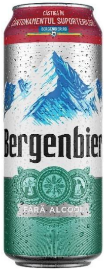
BERGENBIER DOZA 0.5 L