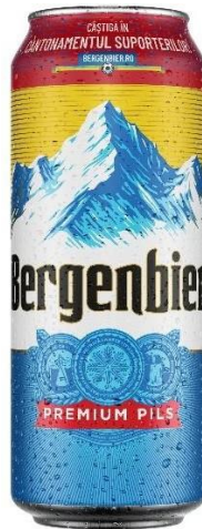
BERGENBIER DOZA 0.5 L