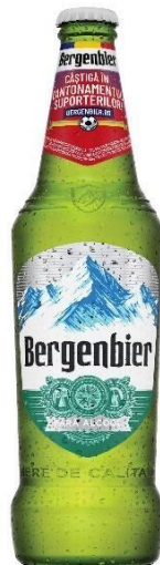
BERGENBIER STICLA 0.5 L NON-ALCOOL