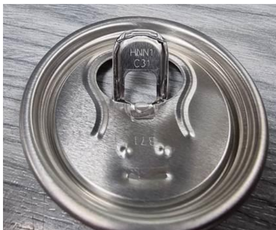
Interior capac cheita CAN