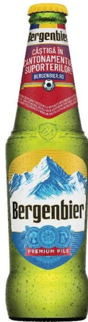
BERGENBIER STICLA 0.33 L