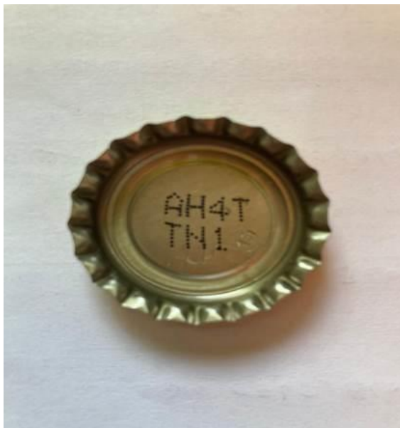
Interior capac Sticla