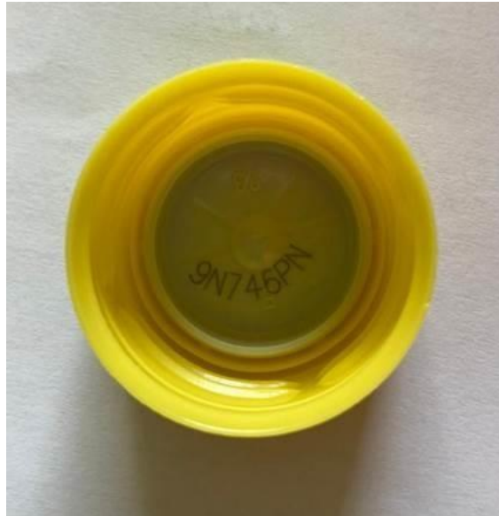
Interior capac PET