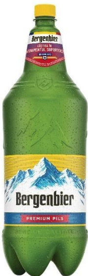
BERGENBIER PET 2.5 L