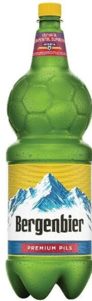
BERGENBIER PET 2.2 L