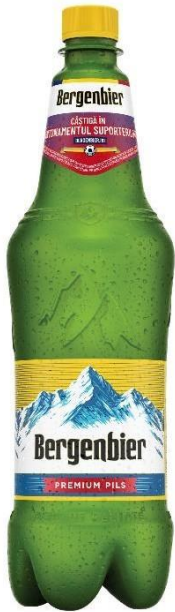
BERGENBIER PET 1 L