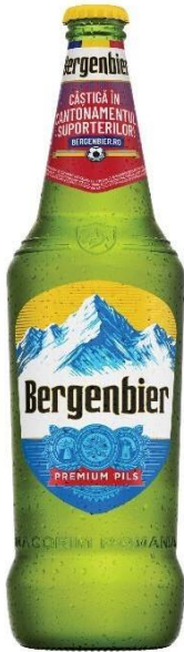
BERGENBIER STICLA 0.75 L